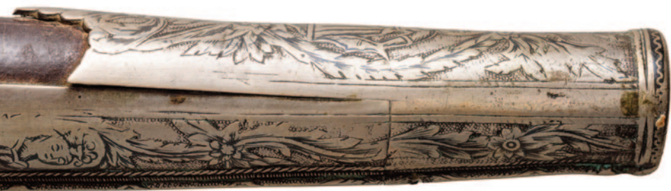
Λοημένα πιστόλα πολεμιστή της Εξόδου με λεπτομέρεια της περίτεχνης κάννης.