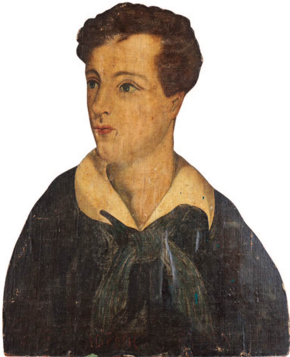
Ο Λόρδος Βύρων σε επιχρωματισμένη ξυλογραφία του Μεσοπολέμου του λαϊκού ζωγράφου, Τάσου Μαντά. Η έλευση και παραμονή του σπουδαίου ποιητή στο Μεσολόγγι για αρκετό διάστημα και ο πρόωρος θάνατός του έστρεψαν το ενδιαφέρον της ευρωπαϊκής κοινής γνώμης στον αγώνα της Ελληνικής Παλιγγενεσίας.