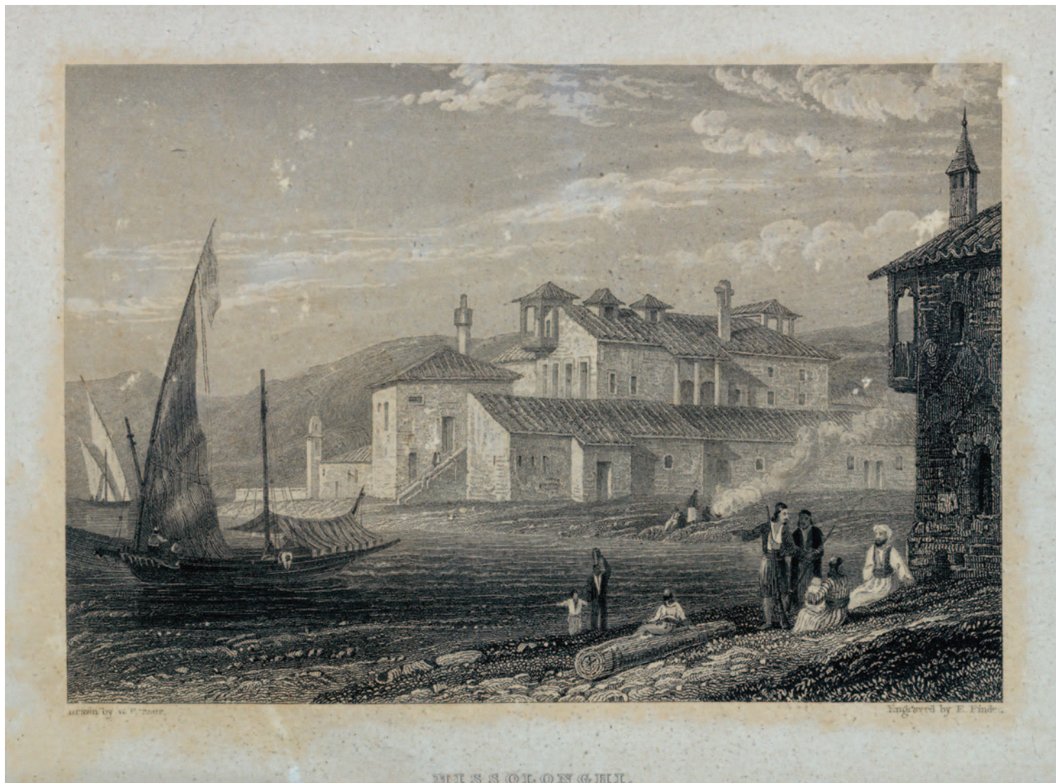
Χαρακτικό με το συγκρότημα οικιών “Καψαλέικα” στο Μεσολόγγι, στο οποίο φιλοξενήθηκε ο λόρδος Βύρωνας κατά την τετράμηνη παραμονή του στην πόλη. Χαρακτικό του Edward Francis Finden (1791-1857).