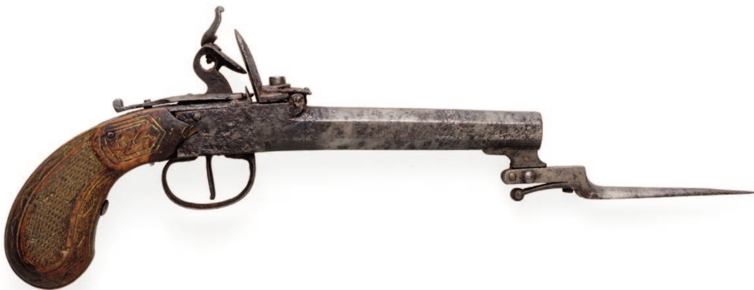
Βελγικό πιστόλι με πυρόλιθο, το οποίο συνήθιζαν να έχουν οι περιηγητές τον 18ο αιώνα για να προστατεύονται από τους ληστές.