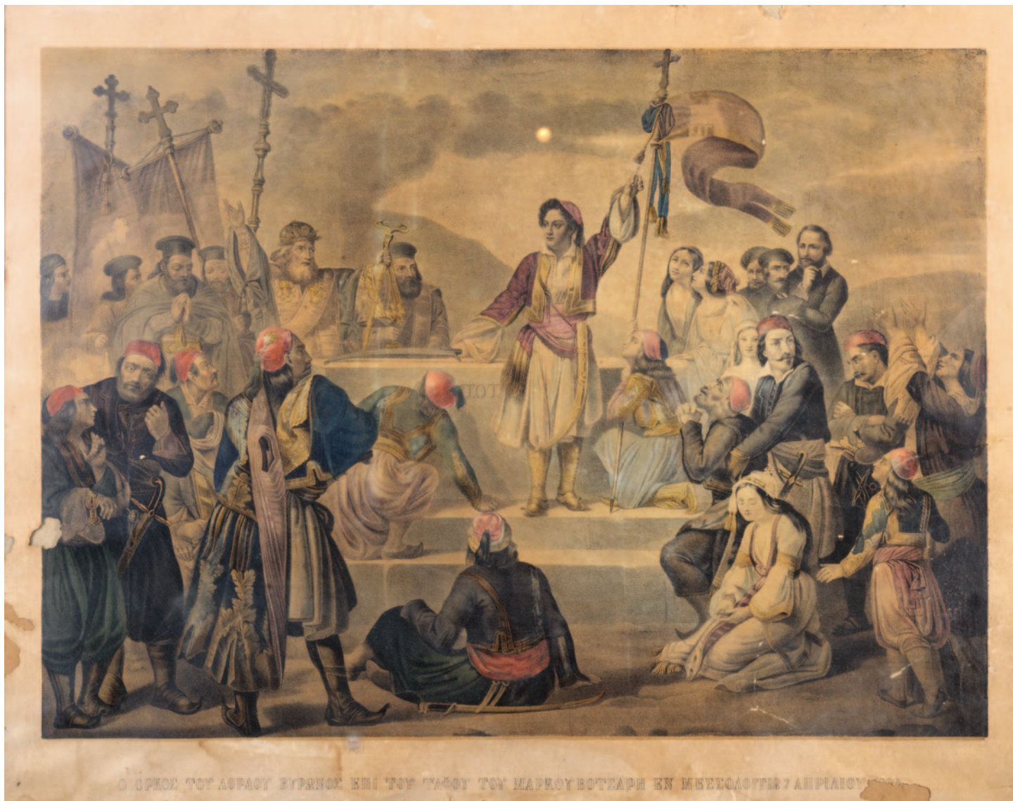
Ο όρκος του Λόρδου Βύρωνα επί του τάφου του Μάρκου Μπότσαρη σε επιχρωματισμένη γκραβούρα εποχής.