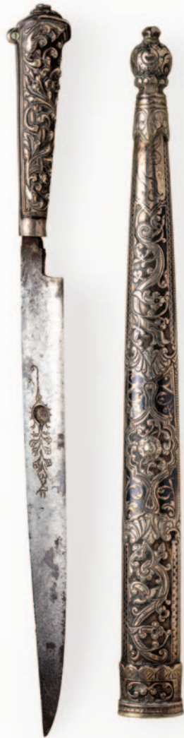
Ασημένιο μαχαίρι της εποχής της Επανάστασης με πλούσιο διάκοσμο από σαβάτι στη θήκη. Η περίτεχνη λαβή και η θήκη του είναι διακοσμημένες με άνθη.