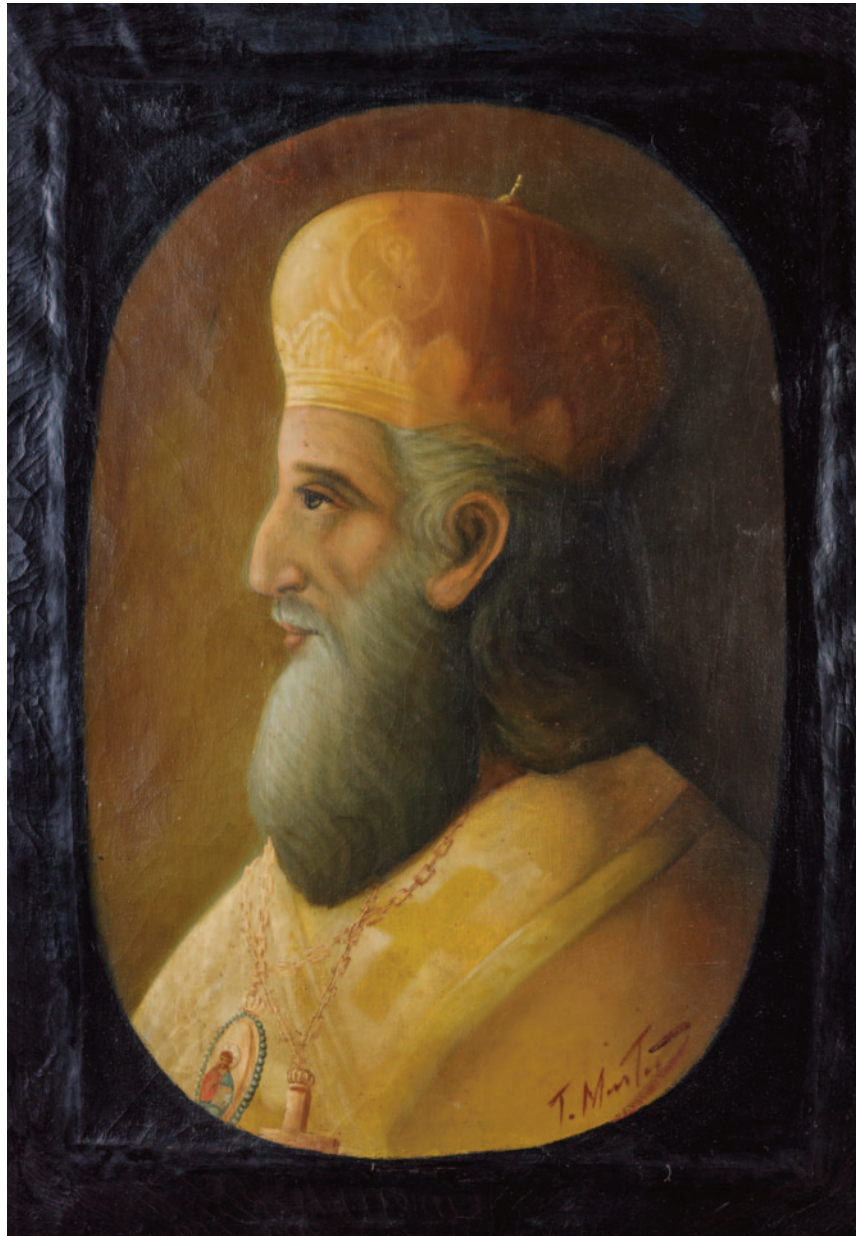
Ο επίσκοπος Ρωγών Ιωσήφ, σε ελαιογραφία του 1934, έργο του αυτοδίδακτου ζωγράφου, Τάσου Μαντά. Έφτασε στο Μεσολόγγι το 1822 και αναδείχθηκε σε ηγετική φυσιογνωμία του αγώνα. Ευλόγησε του αγωνιστές πριν την Έξοδο και μαζί με τον αρχιμανδρίτη Γεράσιμο και τους αναπήρους και τραυματίες κλείσθηκαν στον ανεμόμυλο και τη μπαρουταποθήκη. Όταν μπήκαν στην πόλη οι εχθροί, με τη σύμφωνη γνώμη όλων -και εκείνων που αναγκάστηκαν να επιστρέψουν από την Έξοδο- ανατινάχθηκαν για να πεθάνουν ελεύθεροι!