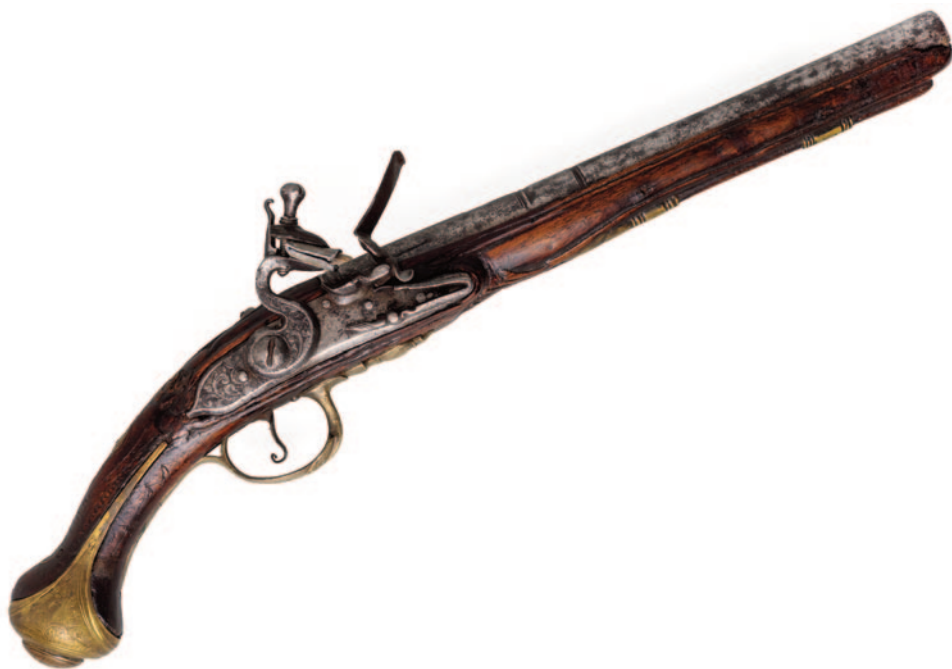
Η πιστόλα του Αθ. Ραζή - Κότοικα με ένθετα μπρούτζινα στοιχεία.