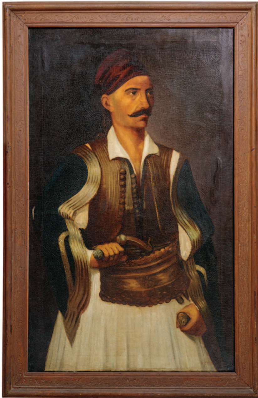
Ο Αθανάσιος Ραζή - Κότσικας σε ελαιογραφία του 1926, έργο του ζωγράφου Νικήτα Γρύσπου (Αμοργός 1873 - Αθήνα 1974). Ο Αθ. Ραζή - Κότσικας ήταν από τους πρωταγωνιστές της ελληνικής επανάσταση στο Μεσολόγγι. Οι συναγωνιστές του τον έχρισαν αρχηγό της Φρουράς των ενόπλων των "ενοπίων αρμάτων". Έπεσε ηρωικά στην Έξοδο του Μεσολογγίου.