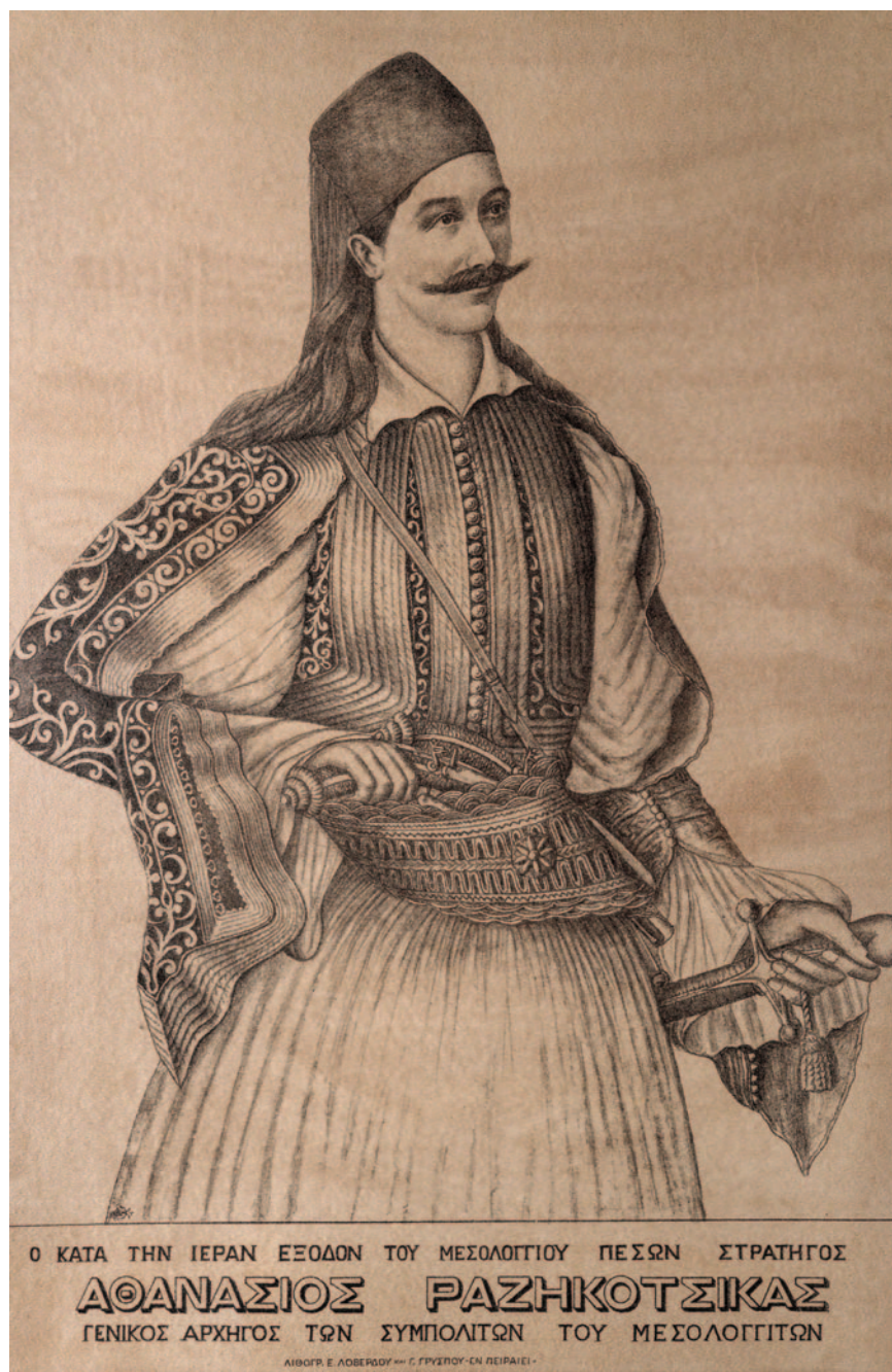
Ο Αθανάσιος Ραζή - Κότσικας σε λιθογραφία του 1926. Με τις στρατιωτικές του ικανότητες οχύρωσε το Μεσολόγγι με τέτοιο τρόπο, ώστε έμεινε απόρρητο σε τρεις πολιορκίες.