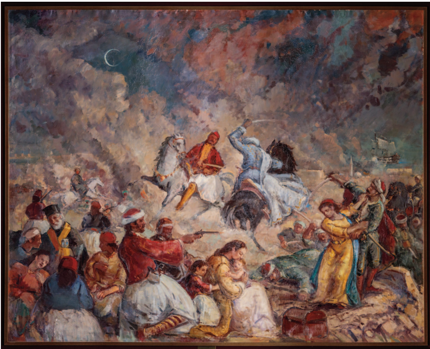
Η Έξοδος του Μεσολογγίου, ελαιογραφία σε μουσαμά του 1954, έργο του Αντώνιου Νίνου (Αλεξάνδρεια 1912 - Παρίσι 1996).