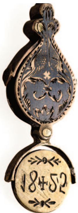
Αμφιπρόσωπος, ασημένιος περίτεχνος σφραγιδόλιθος, αριστερά, αποδιδόμενος στον Παλαιών Πατρών Γερμανό. Δεξιά, ο σφραγιδόλιθος του Αθ. Ραζή-Κότσικα με περίτεχνη χρυσή καδένα.