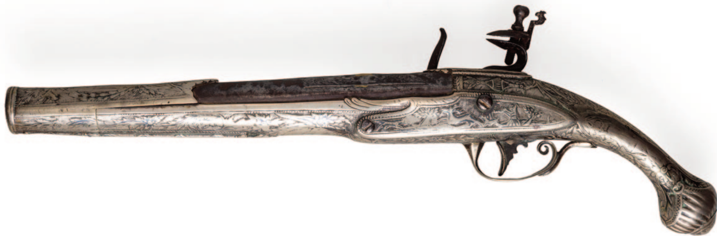
Κουμπούρι με ασημένιο περίβλημα διακοσμημένο με σαβάτι. Ανήκε στον υπαρχηγό της Φρουράς του Μεσολογίου, Γιαννάκη Ραζή-Κότσικα.