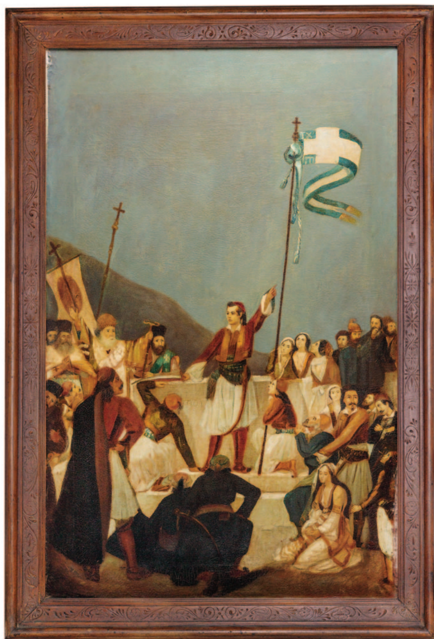
Η υποδοχή του Λόρδου Βύρωνα στο Μεσολόγγι σε ελαιογραφία του 1926, έργο του ζωγράφου Νικήτα Γρύσπου (Αμοργός 1873 - Αθήνα 1974).