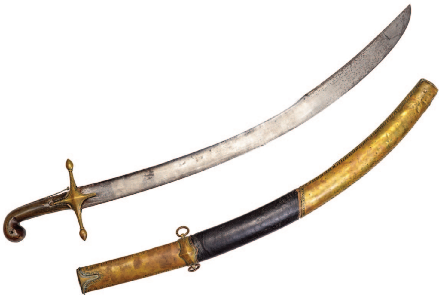
Η σπάθα του Λάμπρου Κουτσονίκα, πρώτου Φρούραρχου Μεσολογίου μετά την απελευθέρωση της πόλης, το 1829.