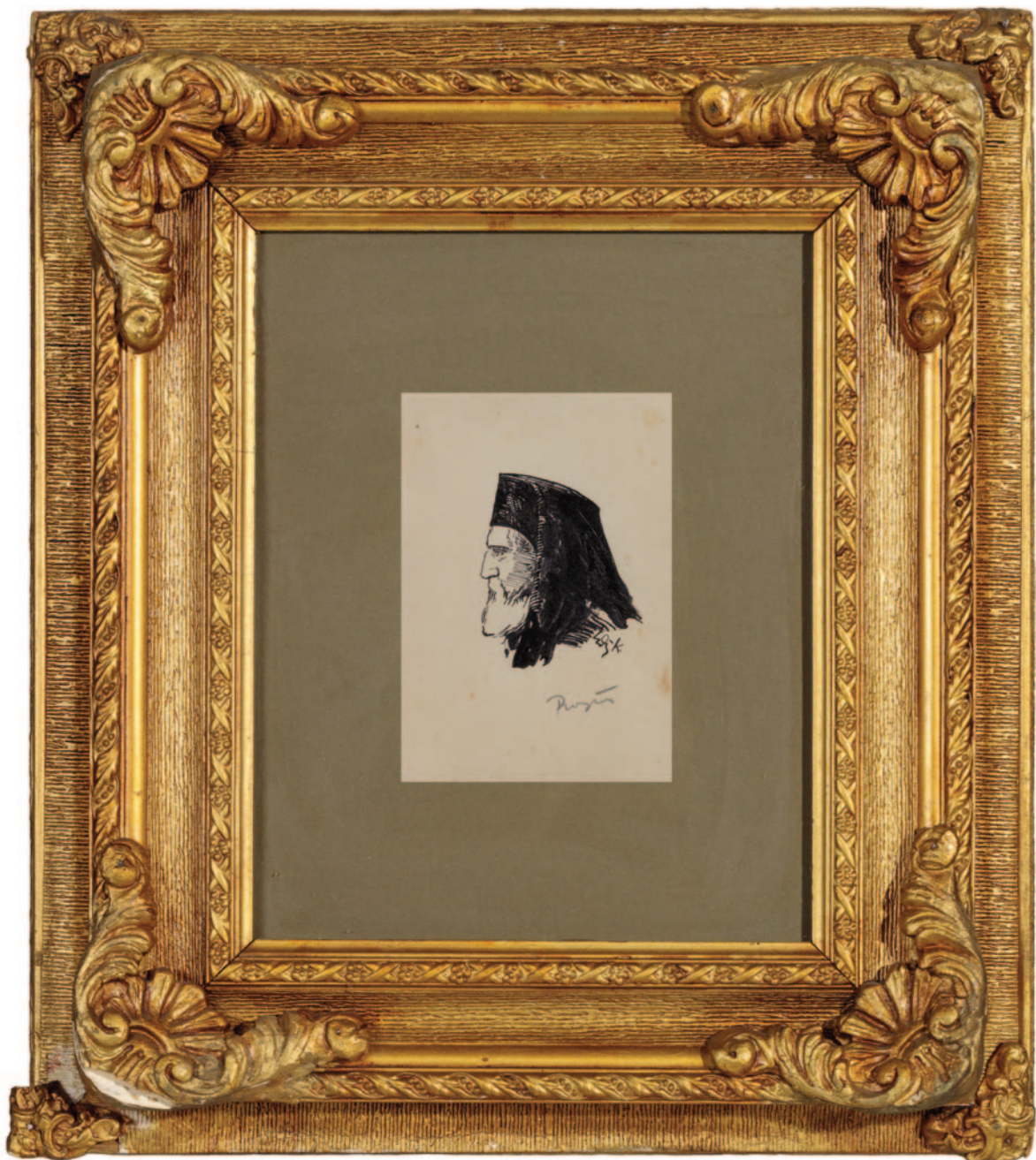
Ο επίσκοπος Ρωγών Ιωσήφ, πενάκι σε χαρτί του 1926, έργο του Γιάννη Τρικογλίδη.