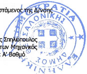
Ανδρέας Σηλιόπουλος Αρχιπέκτων Μηχανικός με Α' Βαθμό