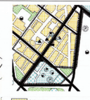
Απόσταση εδάφους γήσινης κατασκευής (Π.Π.2 Σχέδιο Βασικής Η.Ε.Κ 4256/1993)