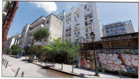
Φωτογραφία από Μονή Μηνής 1