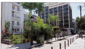
Φωτογραφία από Μονή Μηνής 3