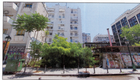
Φωτογραφία από Μονή Μηνής 2