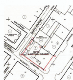
Απόσταση Δρόμου Ρυθμιστικής (Η ΕΚ ΤΡΑΧΑ 2019)