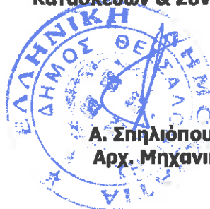
Α. Σπηλιόπουλος Αρχ. Μηχανικός

ΘΕΩΡΗΘΗΚΕ Θεσσαλονίκη, 11 - 9 - 2023 Ο αναπλ. Προϊστάμενος Δ/σης Κατασκευών & Συντηρήσεων