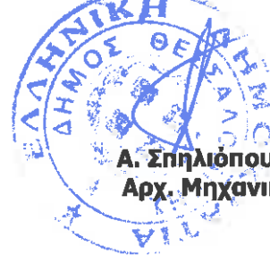
Α. Σπηλιόπουλος Αρχ. Μηχανικός

ΘΕΩΡΗΘΗΚΕ Θεσσαλονίκη, 11 - 9 - 2023 Ο αναπλ. Προϊστάμενος Δ/σης Κατασκευών & Συντηρήσεων