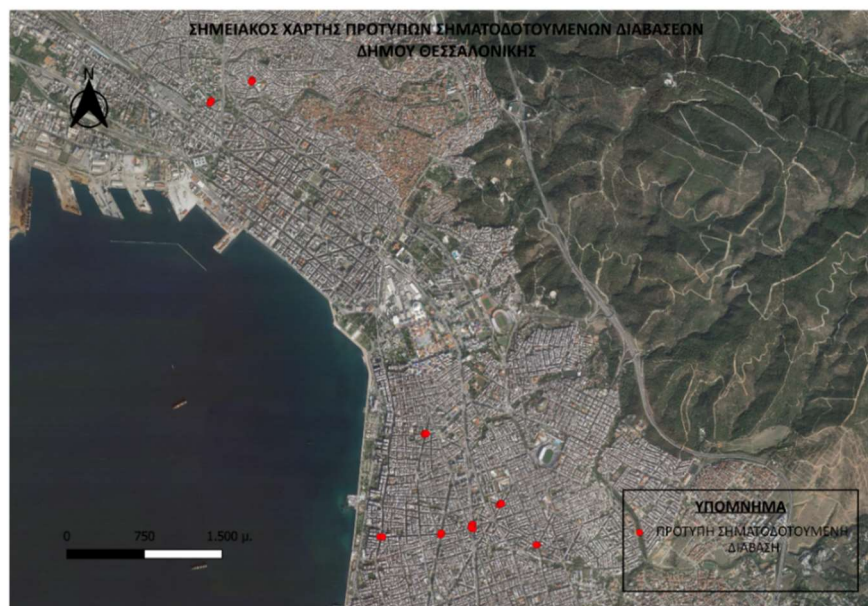
Χάρτης 2: Σημειακός Χάρτης πρότυπων Σηματοδοτούμενων Διαβάσεων - Θεσσαλονίκη