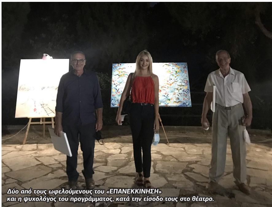
Δύο από τους ωφελούμενους του «ΕΠΑΝΕΚΚΙΝΗΣΗ» και η ψυχολόγος του προγράμματος, κατά την είσοδο τους στο θέατρο.

2 Σε μία προσπάθεια να παρέχουμε στους ωφελούμενους του προγράμματος την ευκαιρία να παραμείνουν κοινωνικά ενεργοί, έχοντας υπόψη μας τις περαιτέρω δυσκολίες που φέρνει στους πιο ευάλωτους συνανθρώπους μας η συνθήκη μιας πανδημίας οργανώσαμε αρκετές κοινωνικές δραστηριότητες. Με την ευγενική χορηγία εισιτηρίων από το Κρατικό Θέατρο Βορείου Ελλάδος, οι εξυπηρετούμενοι του προγράμματος «ΕΠΑΝΕΚΚΙΝΗΣΗ» είχαν την ευκαιρία το καλοκαίρι του 2020 να παρακολουθήσουν τη θεατρική παράσταση «ΟΡΝΙΘΕΣ». Βασικοί στόχοι της δράσης αυτής ήταν η επαφή των ανθρώπων με τα δρώμενα της πόλης και την τέχνη, η κοινωνικοποίηση τους και η ενδυνάμωση των μεταξύ τους σχέσεων και δικτύων.