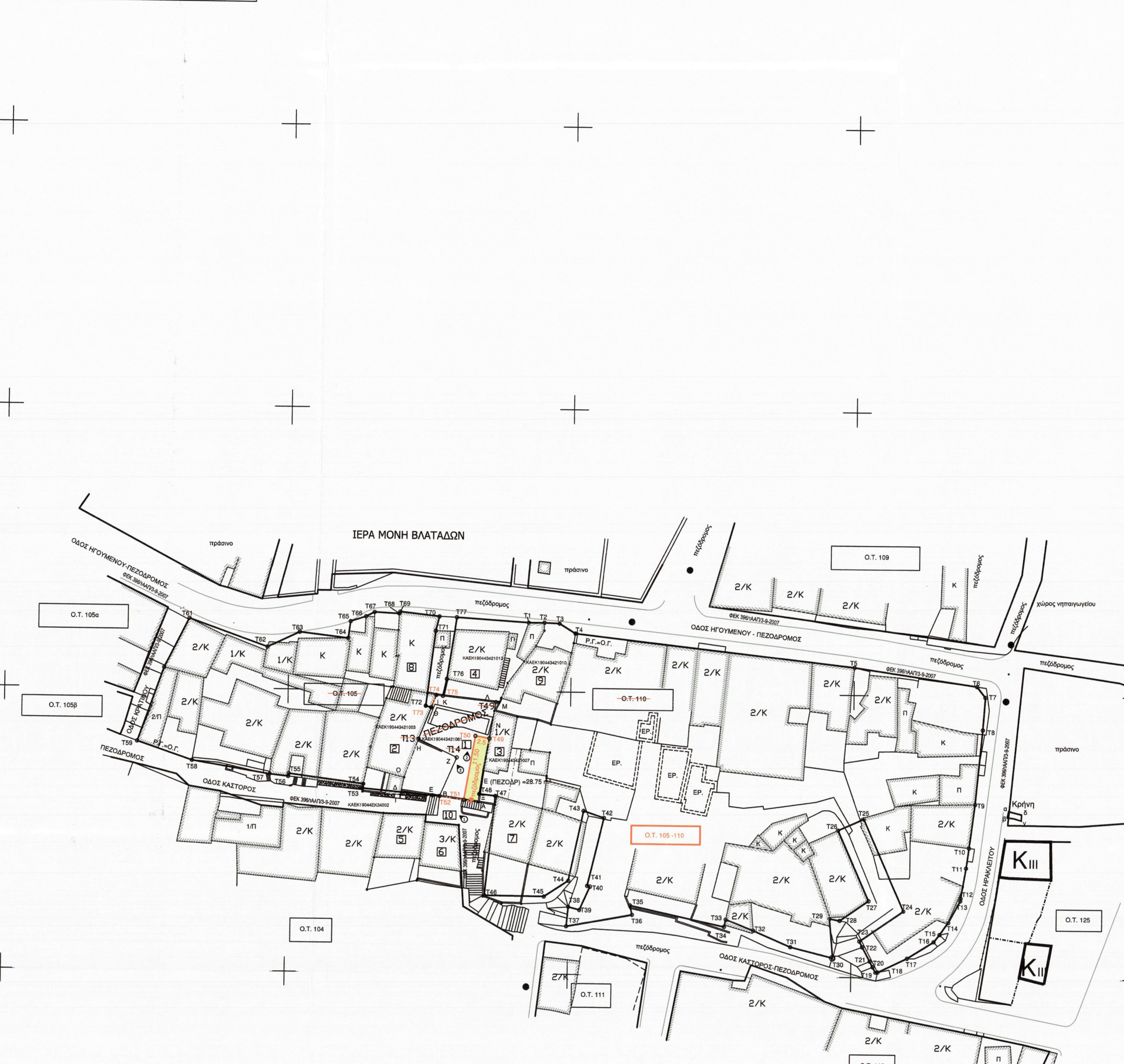
ΑΠΟΣΠΑΣΜΑ ΧΑΡΤΗ ΧΡΗΣΕΩΣ ΓΗΣ ΕΥΚΕΚΡΕΜΕΝΟΥ Γ.Π.Σ. ΔΕΛΦΟΥ ΘΕΣΣΑΛΟΝΙΚΗΣ (ΦΕΚ 420Δ/27-04-1993)

Ελληνικό Γεωδαιτικό Σύστημα Αναφοράς 1987 (Ε.Γ.Σ.Α. 87) Ελλειρωειδές αναφοράς GRS 80 (a = 6 378 137 m, 1f = 298.257222101) Προβολή : Εγκάρσια Μερκατορική Κεντρικός Μεσημβρινός ko = 24°00'00" με Κο = 0.999600 Τμήσηση Κεντρικού Μεσημβρινού : +500 000.00 m Γεωγραφικό Πλάτος Αναφοράς : 0° 00' 00"