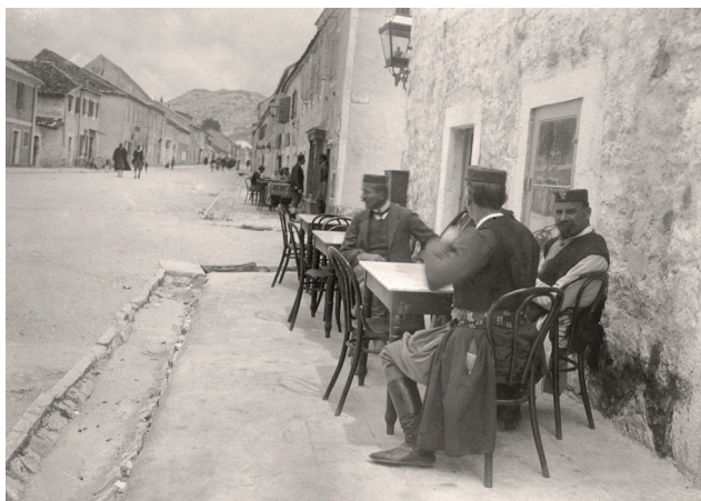
ΔΙΑΛΕΙΜΜΑ ΓΙΑ ΚΑΦΕ ΣΤΗΝ ΚΑΘΗΜΕΡΙΝΗ ΖΩΗ ΕΝΟΣ ΠΑΡΑΔΟΣΙΑΚΟΥ ΜΑΥΡΟΒΟΥΝΙΟΥ ΑΝΔΡΑ Φωτογραφία του Rudolf Mosinger, 1904. National Museum of Montenegro, Cetinje

Η ανάπτυξη μία «κουλτούρας του καφέ» ανάμεσα στις άρχουσες τάξεις και η μετέπειτα διάχυσή της στις αναδυόμενες μεσαίες τάξεις στη διάρκεια του 19 ου αιώνα, αποτέλεσε σημαντικό δείκτη των κοινωνικών αλλαγών, σε περιοχές τόσο υπό