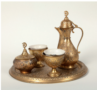
ΣΕΡΒΙΤΣΙΟ ΚΑΦΕ Μπρούντζος, τέλη 19 ου , αρχές 20 ου αι., Σκόπια. Museum of Macedonia, Σκόπια

Οθωμανική, όσο και υπό Αυστροουγγρική επιρροή: ανάδειξη δημοσίων χώρων, εκδημοκρατισμός του προσωπικού χώρου και χρόνου, νέα μοντέλα κοινωνικοποίησης και συνύπαρξης. Η έκθεση αυτή ανοίγει με ένα καφενείο, προκειμένου να αναδείξει τη βασική ενότητα των συλλογικών αναμνήσεων και προσωπικών ιστοριών.