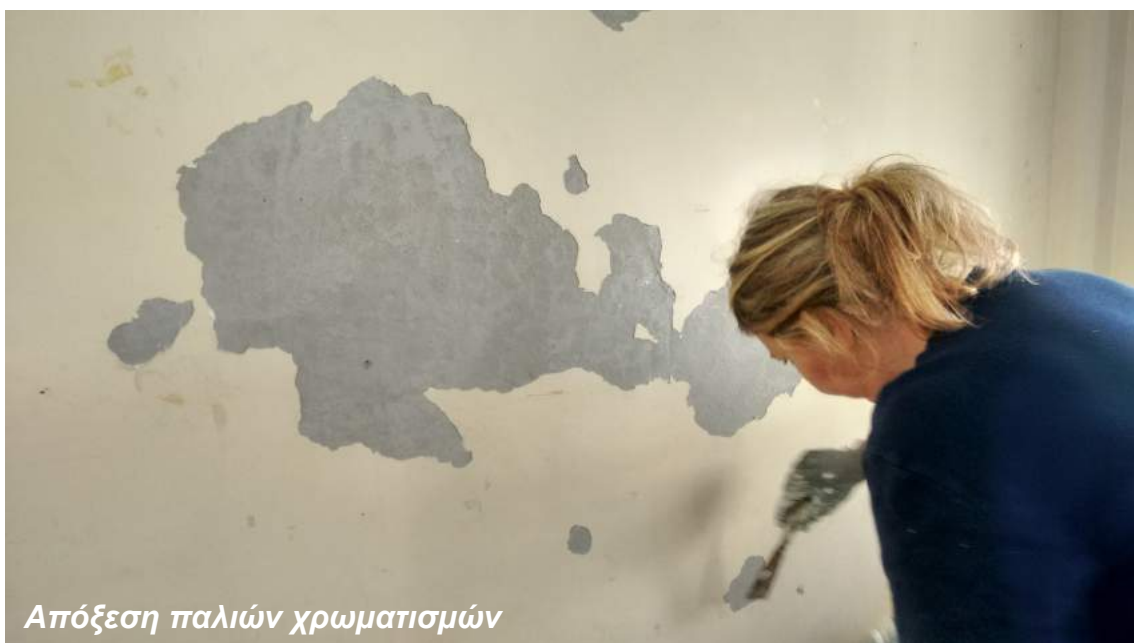
Απόξεση παλιών χρωματισμών

Η εργασίες επισκευών περιλάμβαναν, μικροεπισκευές ξύλινων ή μεταλλικών θυρών και παραθύρων.