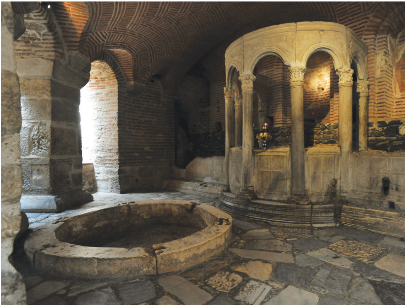
Η ημικυκλική δεξαμενή αγιάσματος, στην κρύπτη του Αγίου Δημητρίου. Das halbkreisförmige Weihwasserbassin in der Krypta der Agios-Dimitrios-Kirche.

Sie wurde auf den Ruinen eines öffentlichen römischen Thermalkomplexes errichtet. Der Tradition nach wurde während der diokletianischen Verfolgungen der römische Bürger und Offizier des Römischen Heeres Demetrius (Dimitrios) dort gefangen gehalten und starb den christlichen