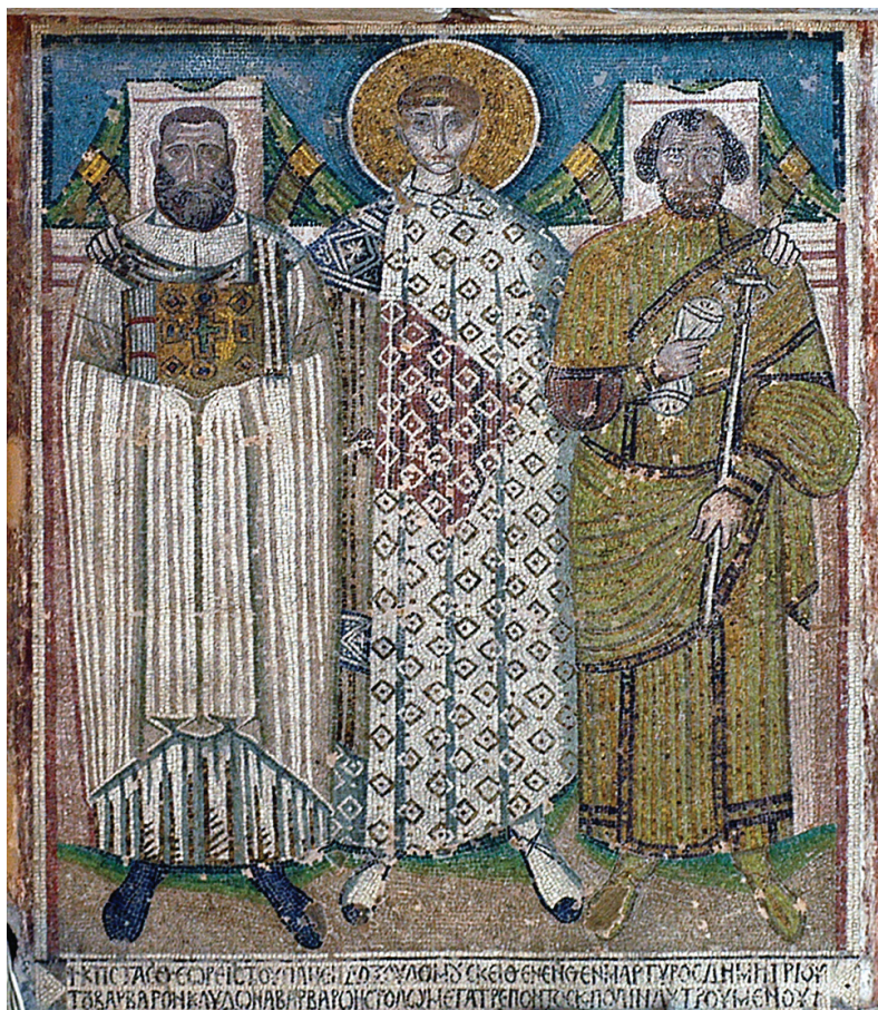
Ψηφιδωτό του Αγίου Δημητρίου με τους κτίτορες του Ναού.

Mosaik der Kirche Agios Dimitrios, das die Gründer der Kirche darstellt.