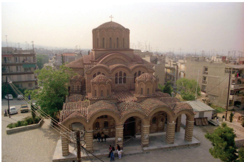
Η εκκλησία του Προφήτη Ηλία. Die Kirche des Propheten Elias.

Η ταύτιση του επιβλητικού σε μέγεθος παλαιολόγειου ναού παραμένει αινιγματική, διότι η αρχική του ονομασία ξεχάστηκε στα πεντακόσια σχεδόν χρόνια δουλείας. Η αφιέρωσή του στον Προφήτη Ηλία είναι νεότερη και οφείλεται στην παρετυμολογία του τουρκικού ονόματός του Saraylı tzaḡmi. Ο αρχιτεκτονικός τύπος του ναού που αρμόζει σε καθολικό μοναστηριού και η θέση του στην περιοχή, όπου αναζητούνται τα βυζαντινά ανάκτορα, τα οποία κήκαν κατά την εξέγερση των Ζηλωτών το 1342, παρακίνησαν πολλούς ερευνητές να τον ταυτίσουν με τη Νέα Μονή, η οποία ιδρύθηκε μεταξύ των ετών 1360 και 1370 από το μοναχό και συγγραφέα Μακάριο Χούμνο. Η Νέα Μονή ήταν αφιερωμένη στην Παναγία και υπήρξε από τα σημαντικότερα μοναστηριακά ιδρύματα της πόλης στο δεύτερο μισό του 14 ου αι. Η ταύτιση αυτή κλονίστηκε από μαρτυρίες τουρκικών πηγών, οι οποίες αναφέρουν τη μετατροπή του ναού σε tzaḡmi λίγο μετά το 1430 από τον Badrali Mustafa Paşa, ενώ αντίθετα η Νέα Μονή ήταν σε λειτουργία τουλάχιστον ως το 1556. Άλλες έρευνες, επί του εικονογραφικού προγράμματος των τοιχογραφιών συμπέραναν ότι ήταν