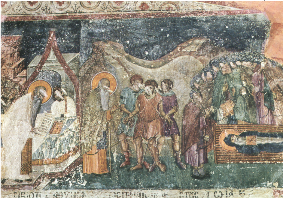
Τοιχογραφία του 14 ου αιώνα, από το παρεκκλήσιο του Αγίου Ευθυμίου, με θέματα από τη ζωή του Αγίου. Wandmalerei des 14. Jahrhunderts in der Kapelle Agios Eftymios mit Szenen aus dem Leben des Heiligen.

Το σημερινό κτίριο άρχισε να κτίζεται το 1891, σε σχέδια του αρχιτέκτονα Vitaliano Poselli και σε θέση λίγο χαμηλότερα από το παλιό Κονάκι, το οποίο καταδαφίστηκε την ίδια χρονιά. Σε αυτό στεγάζονταν διάφορες υπηρεσίες της τουρκικής Διοίκησης (δημοτολόγιο, λογιστήριο, κτηματολόγιο, υποθηκοφυλακείο, ειρηνοδικείο, η μεγάλη αίθουσα του νομαρχιακού συμβουλίου επιπλωμένη με μυθώδη πολυτέλεια, διεύθυνση εξωτερικών υποθέσεων, αστυνομίας και κωροφυλακής, το πρωτοδικείο και εμποροδικείο, το ιεροδικείο). Το 1907 στέγασε την τουρκική Νομική Σχολή, το 1911 κατέλυσε σε αυτό ο σουλτάνος Μωάμεθ Ε΄, όταν επισκέφθηκε τη Θεσσαλονίκη. Το 1954 αποφασίστηκε η επισκευή του και η συγκέντρωση σε αυτό όλων των υπηρεσιών της Γενικής Διοίκησης (Βορείου Ελλάδος, εκείνης της εποχής), ενώ με την ανακαίνιση έγινε και η προσθήκη του τετάρτου ορόφου, που ολοκληρώθηκε το 1955.