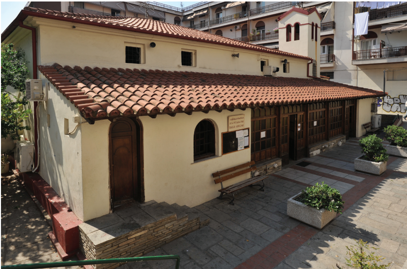
Ο Ιερός Ναός της Λαοδηγήτριας Θεσσαλονίκης. Die Heilige Kirche Panagia Laodigitria in Thessaloniki.

Die Identität dieser imposanten, paläologischen Kirche bleibt rätselhaft, weil ihr ursprünglicher Name während einer Zeit von fast 500 Jahren fremder Herrschaft in Vergessenheit geraten ist. Ihre Widmung dem Propheten Elias ist jünger und liegt an der falschen Etymologie des türkischen Namens des Denkmals 'Sarayli Moschee'. Ihre Bauform, die der eines klösterlichen Katholikons gleicht, und ihre Lage, wo die Archäologen den byzantinischen Palastkomplex zu finden erwarten – der Palast wurde 1342 während des Aufstands der Zeloten verbrannt – haben viele Forscher dazu geführt, diese Kirche mit dem Neuen Kloster zu identifizieren, das zwischen den Jahren 1360 und 1370 vom Mönch und Schriftsteller Makarios Houmnos gegründet wurde. Das Neue Klos-