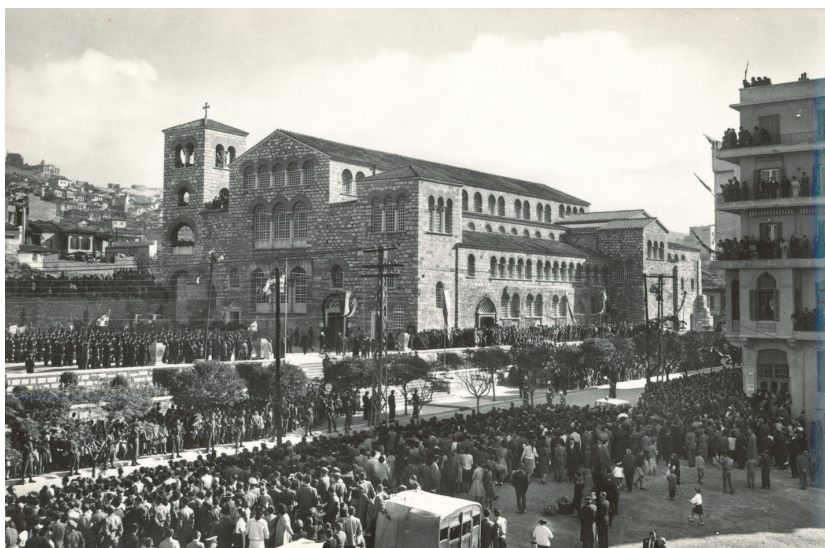
Ο Ιερός Ναός του Αγίου Δημητρίου, κατά τη διάρκεια του εορτασμού του πολιούχου της πόλης. Die Heilige Kirche Agios Dimitrios während der Feier zu Ehren des Schutzheiligen der Stadt.