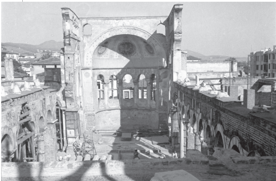
Ο Ιερός Ναός του Αγίου Δημητρίου, μετά την καταστροφική πυρκαγιά του 1917. Die Heilige Kirche Agios Dimitrios nach dem zerstörerischen Brand im Jahre 1917.

Κτίστηκε σε χώρο, όπου κατά τα ρωμαϊκά χρόνια υπήρχε ένα συγκρότημα δημοσίων λουτρών. Μέσα σε αυτές τις θέρμες, κατά την παράδοση, την εποχή των διωγμών του Διοκλητιανού φυλακίστηκε, μαρτύρησε και θανατώθηκε ως χριστιανός ο ρωμαίος πολίτης και αξιωματούχος Δημήτριος. Μετά το διάταγμα ανεξιθρησκίας του Μεδιολάνου το 313, διαμορφώθηκε σε τμήμα του λουτρούνα, μικρός, λατρευτικός “οικίσκος” στο χώρο του μαρτυρίου του αγίου, όπου πίστευαν ότι υπήρχε και ο τάφος του. Τον 5 ο αιώνα ο έπαρχος του Ιλλυρικού Λεόντιος έκτισε μεγάλη βασιλική στον ίδιο χώρο, όπου μετέφερε και τον τάφο του αγίου μέσα σε κιβώριο, στο κεντρικό κλίτος. Η βασιλική του 5 ου αιώνα κάηκε μετά το σεισμό του 620 και ανακαινίστηκε με επιστοσία του επισκόπου Θεσσαλονίκης και του επάρχου Λέοντος. Η βασιλική του 7 ου αιώ-