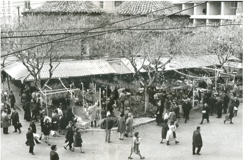
Η περιοχή των Λουλουδάδικων Θεσσαλονίκης, μπροστά από το λουτρό της Μεγάλης Αγοράς, σε φωτογραφία του 1973.

Ανεγέρθηκε από το μηχανικό Ελί Μοδιάνο το 1922 και καλύπτει τμήμα του οικοδομικού τετραγώνου μεταξύ των οδών Αριστοτέλους, Ερμού, Κομνηνών και Βασ. Ηρακλείου. Είναι ένα απλό ορθογώνιο κτίσμα με αετωματική πρόσοψη που σκεπάζεται με γυάλινη στέγη. Το συνολικό συγκρότημα διασχι-