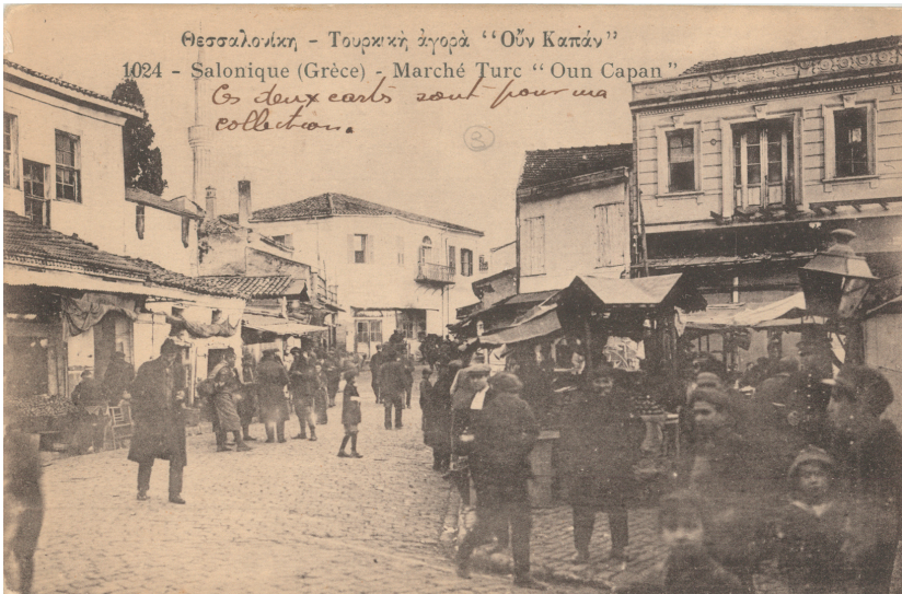
Η αγορά "Καπάνι", σε καρτ-ποστάλ των αρχών του 20 ου αιώνα.

Το κτίριο, ένα από τα σημαντικότερα οθωμανικά μνημεία της πόλης, βρισκόταν στην καρδιά της αγοράς, βασικό σημείο αναφοράς της τουρκοκρατούμενης Θεσσαλονίκης. Η τουρκική ονομασία προέρχεται από τη λέξη bez που σημαίνει ύφασμα βαμβακερό ή λινό και τα κτίρια αυτά ήταν κατά κύριο λόγο αγορές πολυτελών υφασμάτων. Ωστόσο στέγαζαν και άλλες αγορές πολυτιμών και ευπαθών εμπορευμάτων, για το λόγο αυτό και φρουρούνταν. Το Μπεζεστένι της Θεσσαλονίκης κτίστηκε τον 15 ο αιώνα. Η ανέγερσή του αποδίδεται, ή στο Σουλτάνο Μεχμέτ Β' κατά το 1455 ή λίγο αργότερα, ή στο Σουλτάνο Βαγιαζίτ Β' προς τα τέλη του ίδιου αιώνα. Είναι ένα ορθογώνιο κτίσμα με εισόδους στο κέντρο κάθε πλευράς, εσωτερικά διαιρείται σε έξι τετράγωνα, καλύπτεται δε με έξι μολυβδοσκεπάστους θόλους, οι οποίοι αντιστοιχούν στην εσωτερική διάταξη του κτιρίου. Τα εξωτερικά, περιμετρικά καταστήματα προστέθηκαν στις αρχές του 20 ου αιώνα. Κατά τις αναστηλωτικές εργασίες που έγιναν στο μνημείο μετά το 1978, αποκαλύφθηκαν στα μολύβδινα φύλλα κάλυψης των τρούλων