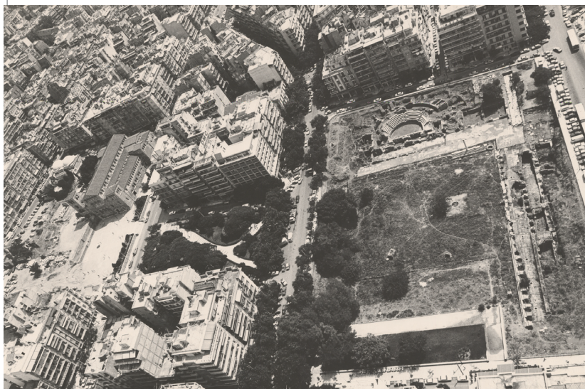
Αεροφωτογραφία της περιοχής της Αρχαίας Αγοράς, του 1983.

Luftbild des Gebietes des antiken Forums, Aufnahme aus dem Jahr 1983.