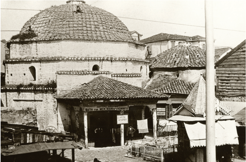
Τα λουτρά “Παράδεισος”, σε φωτογραφία των αρχών του 20 ου αιώνα. Die Bäder ‘Paradies’ auf einem Foto aus dem frühen 20. Jahrhundert.

Η κύρια οδική αρτηρία της πόλης εντός τειχών, η ρωμαϊκή Via Regia, περνούσε κάτω από τη σημερινή οδό Εγνατία στον ίδιο περίπου άξονα, ενώνοντας τις δύο κύριες πύλες των τειχών, τη Χρυσή Πύλη στα δυτικά και την Κασσανδρεωτική Πύλη στα ανατολικά. Στα βόρεια αυτής της κύριας οδού, στον άξονα της οδού Αριστοτέλους, βρισκόταν η είσοδος της Ρωμαϊκής Αγοράς. Ήταν ένα μνημειακό συγκρότημα με πλατείες και δημόσια κτίρια. Στη νότια κιονοστοιχία της κάτω πλατείας της Αγοράς ανήκαν οι Incantadas, αγάλματα που βρίσκονται σήμερα στο Λούβρο. Στη βόρεια πλευρά της Αγοράς υπήρχαν μεγάλα δημόσια