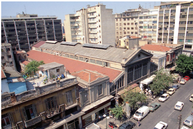
Το κτίριο της Στοάς Μοδιάνο, κεντρικής αγοράς τροφίμων Θεσσαλονίκης.

Στο εμπορικό κέντρο της Θεσσαλονίκης μεταξύ των οδών Ερμού – Ίωνος Δραγούμη – Εγνατίας – Μητροπ. Γενναδείου – Καρόλου Ντηλ, σχηματίζονται τρία συγκροτήματα αγορών που αποτελούν σημαντικότερα σημεία αναφοράς της εμπορικής ζωής της Θεσσαλονίκης και αποτελούν αναπόσπαστα τμήματά της για πολλές δεκαετίες, θα λέγαμε για αιώνες. Πολλές ενδείξεις μας πείθουν ότι στην ίδια θέση υπήρχαν αγορές από την εποχή της τουρκοκρατίας, κατά τα πρότυπα των μεσαιωνικών ανατολικών κρατών. Η περιοχή της κυρίως Αγοράς άρχιζε από την Εγνατία, που ήταν γνωστή και ως ο «Φαρδύς δρόμος» και έφτανε ως τη νότια πλευρά της εκκλησίας του Αγίου Μηνά. Ανατολικά είχε όριο την περιοχή από την Παναγία Χαλκέων ως το λουτρό της Αγοράς (οδός Κομνηνών – Βασ. Ηρακλείου) και δυτικά τη λεωφόρο Υαλί Καρиси (Πύλη της Παραλίας). Στα στενά δρομάκια αυτής της περιοχής συγκεντρωνόταν η μεγαλύτερη εμπορική δραστηριότητα της πόλης. Στην καρδιά της ίδιας ζώνης υπήρχε η Αλευραγορά (Un Karani), που στα παλαιότερα τουρκικά «τεφτέρια» αναφέρεται ως Karan-i Galle, το Καπάνι, μια ονομασία που ακόμη διατηρείται και αναφέρεται από τους Θεσσαλονικείς για την ίδια αγορά. Από τις αρχές όμως του 20 ου αιώνα δεν αποτελούσε πια αγορά αλεύρων, αλλά μια αγορά