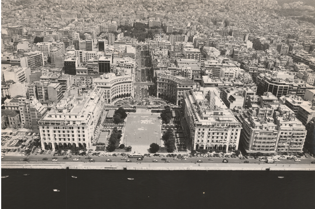
Αεροφωτογραφία του μνημειακού άξονα της πλατείας και της οδού Αριστοτέλους. Luftbild der monumentalen Achse des Aristotelous-Platzes und der Aristotelous-Straße.

σώζονται στο ναό, καθώς και αυτά που βρίσκονται στο Μουσείο Βυζαντινού Πολιτισμού της Θεσσαλονίκης, ο αρχικός ναός ανάγεται στην παλαιοχριστιανική εποχή και στον τύπο της βασιλικής.